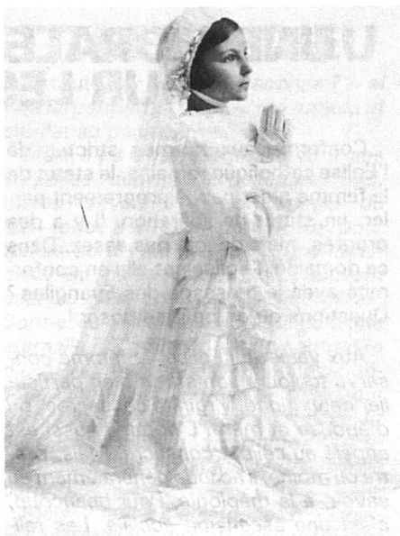
Une communiant des années 30 : promise à un destin de mère au foyer ou de vierge. Et aujourd'hui ?

Cette encyclique a été rédigée malgré les recommandations contraires de la commission d'experts désignée par Paul VI. Elle a d'emblée rencontré une forte op-