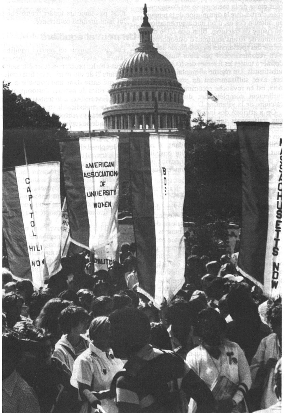
Manifestation pro-ERA à Washington