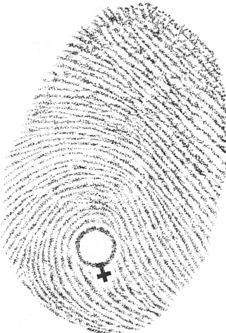
Dessin de couverture de Femmes d'Europe, 15 septembre/15 novembre 1983

« Des travaux sont considérés comme équivalents lorsque deux personnes n'effectuent pas un travail identique mais que,