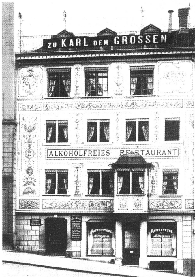
Karl der Große, Kirchgasse 14, le jour de son ouverture en 1898

En outre, il a d'emblée assuré une vraie formation professionnelle à son personnel et lui a proposé des loisirs éducatifs, leçons de gymnastique et de couture par exemple. Dès 1904, il a créé une caisse de retraite. Il a toujours été en avance sur son temps en ce qui concerne les conditions de travail, les congés, les vacan-