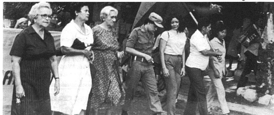
Manifestation politique avec l'AMNLAE ; 3e depuis la gauche, la mère d'Ortega et d'autres mères ayant perdu leurs fils sous Somoza.

F.S. — L'usage de leurs nouveaux droits par les femmes suscite-t-il des résistances ?