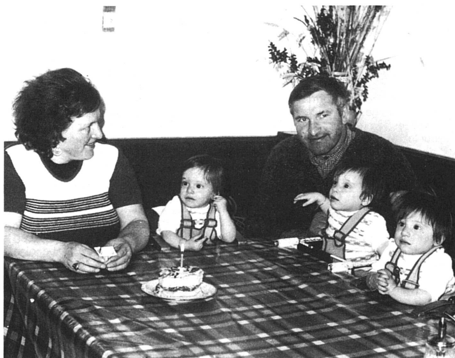
Alléger les charges de la famille.