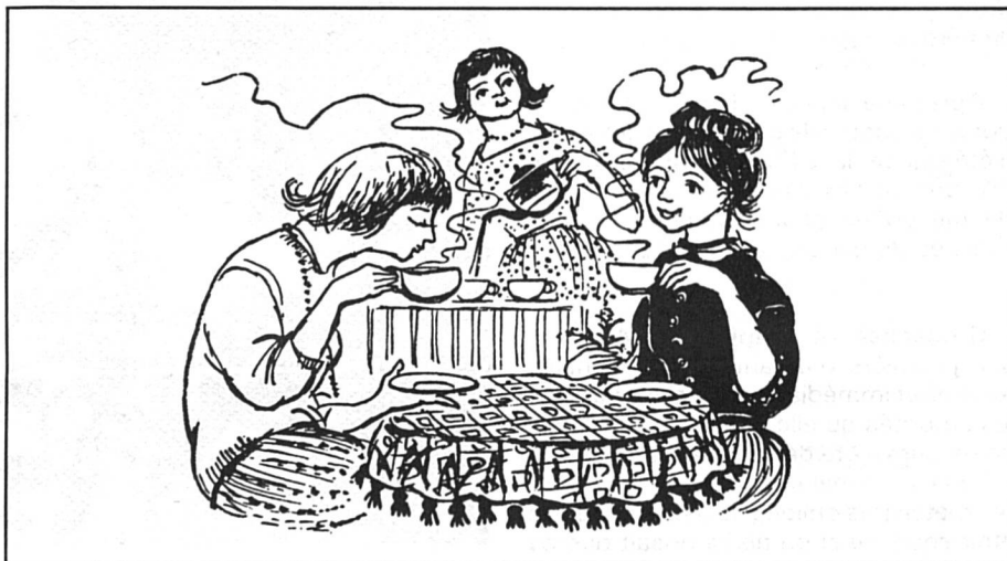
D'après le T.F., en Suisse, encore aujourd'hui les femmes papotent au tea-room tandis que les hommes vont au charbon...

En Appenzell RE , la question du droit de vote des femmes a connu, fin août, des développements dont, pour des raisons de délais, nous ne pourrions vous informer que dans le prochain numéro. Dans les RI également, quelques partisans persévérants essaient cette fois de proposer qu'on donne aux femmes le droit de vote et d'éligibilité au plan communal — que les femmes possèdent déjà