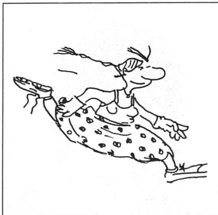
La course au recyclage... (Bulletin ISIS)

Ces demandes étaient de trois ordres : tout d'abord, l'abolition des obstacles juridiques et administratifs à une bonne formation pour les femmes ; ensuite, une bonne information de la population quant à ses droits et une sensibilisation des milieux concernés par la formation ; enfin, une amélioration de la prise en charge des enfants par les services publics.