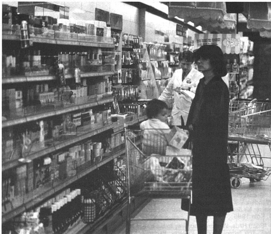
Pour les mères seules, un budget souvent serré.