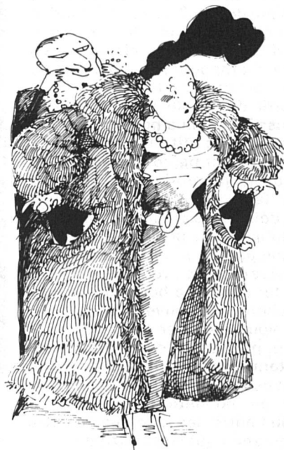
La femme mariée Pauvreté invisible

Anne Wilsdorf, Agenda des Femmes , 1987.