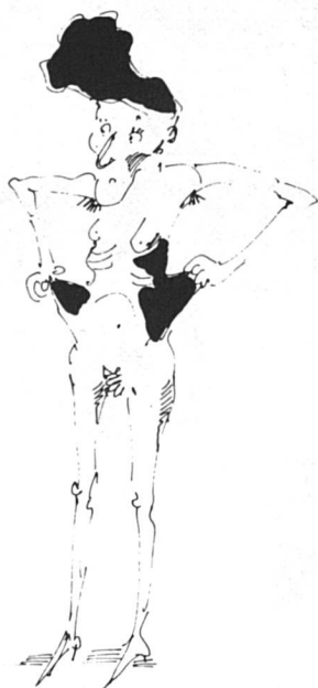
La femme divorcée Pauvreté visible

Mais pour d'autres femmes c'est le contraire. C'est justement parce qu'elles sont mariées, parce qu'elles restent à la maison et sont ainsi exclues du monde du travail, c'est parce que leur indépendance économique est liée au bon vouloir de leur mari qu'elles peuvent devenir des pauvres « invisibles ».