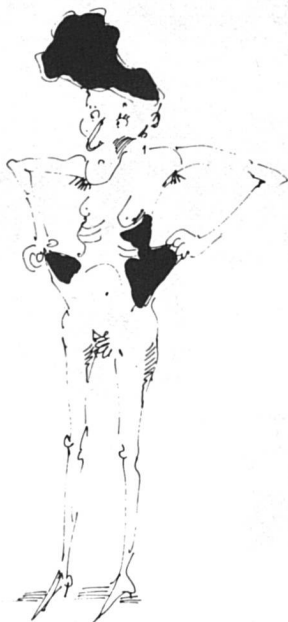
La femme divorcée Pauvreté visible

Mais pour d'autres femmes c'est le contraire. C'est justement parce qu'elles sont mariées, parce qu'elles restent à la maison et sont ainsi exclues du monde du travail, c'est parce que leur indépendance économique est liée au bon vouloir de leur mari qu'elles peuvent devenir des pauvres « invisibles ».