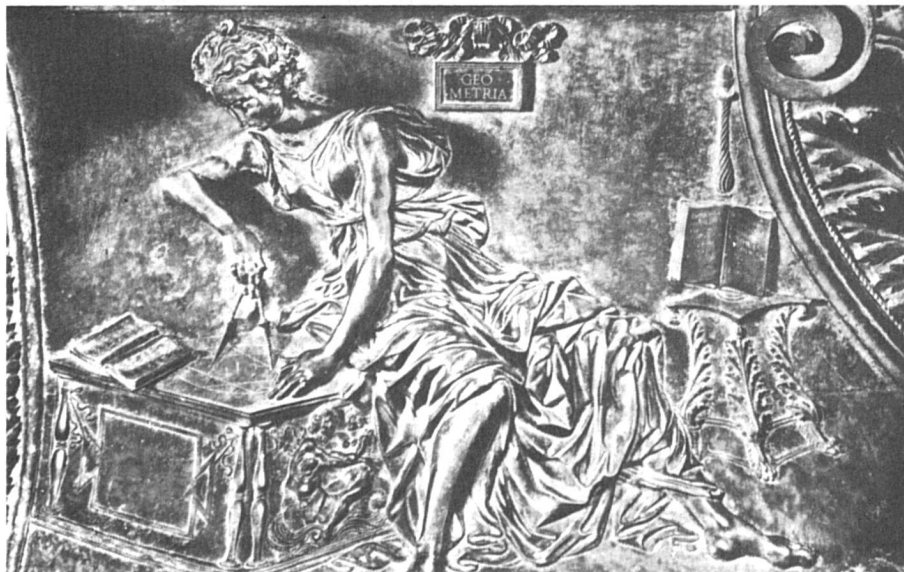
« La Géométrie », A. del Pollaiuolo, Monument à Sixte IV, Rome.