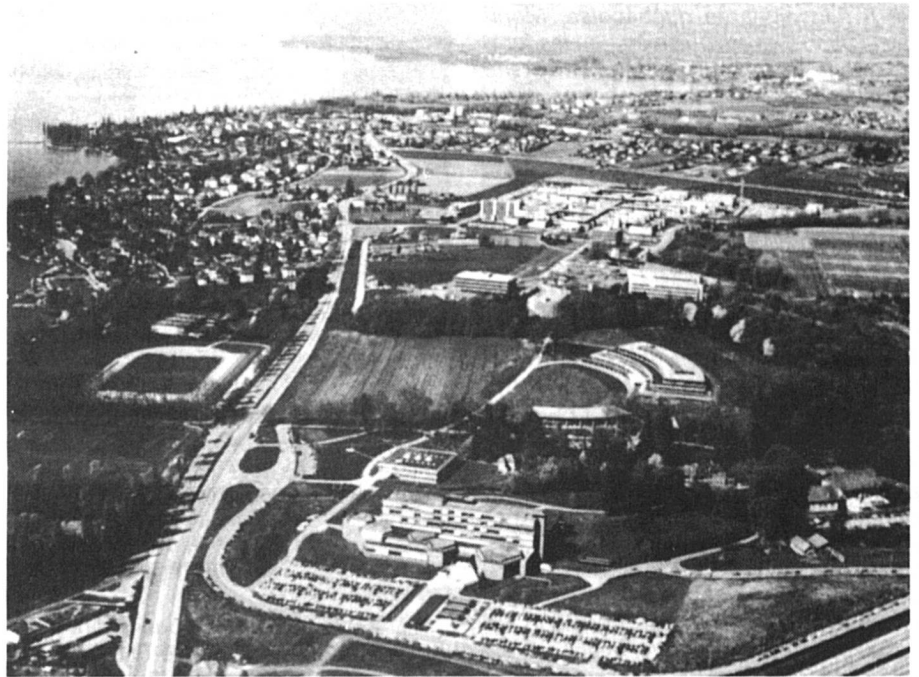
Vue aérienne de l'Université de Lausanne à Dorigny : tout près du lac, où se noient tant d'illusions !

mise au concours de poste professoral n'est pas retenue. Mais pour ne pas lui claquer la porte au nez après 15 ans de service, on lui donne généralement une année d'un poste quelconque, pour qu'elle puisse se retourner et trouver autre chose.