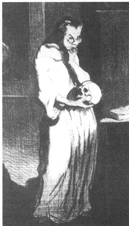
Femme de lettre humanitaire se livrant sur l'homme à des réflexions crânement philosophiques | selon H. Daumier.

Les femmes ont compris qu'elles nageaient en pleine utopie et que pour avoir la moindre chance de gagner dans un jeu où les règles ont été écrites par des hommes pour des hommes, il leur fallait s'incliner comme une femme. Aussi ont-elles fini par apprendre et appliquer ces règles, somme toute assez simples, et qui sont au nombre de deux pour qui postule à une position dans le corps professoral : première exigence sans laquel-