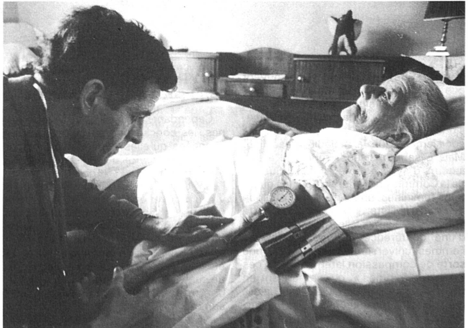
La consommation médicale augmente avec l'âge...