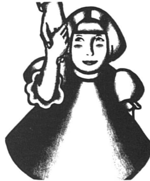
Pour éviter à d'autres enfants la souffrance de la séparation. Dessin Ms/31

A l'heure où vous lisez ces lignes, vous avez sans doute déjà vu leurs photos dans la presse quotidienne : cinq mères d'enfants franco-algériens enlevés par leur père algérien