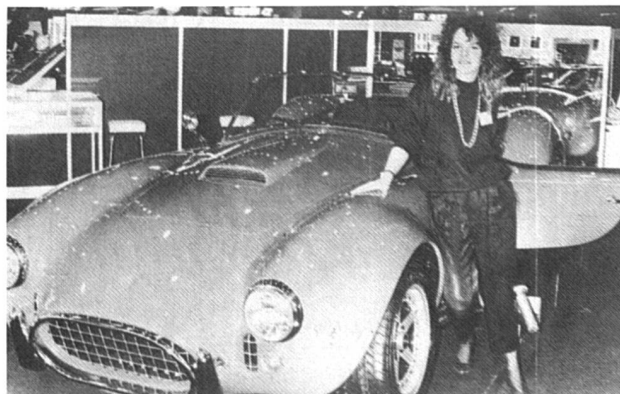
La belle et la Bête

A propos de la légende de la photo du bas : « On ne précise pas laquelle est laquelle... » Légende du haut : sans commentaire. (Tribune de Genève du 5 mars.)