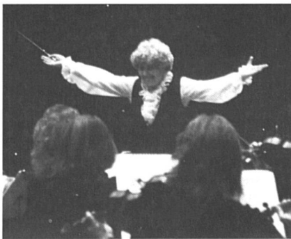
Photo du film « Les femmes chefs d'orchestre », de Christine Olofson .

Dès les premières images du film, on travaille, on peine, on s'essouffle, on s'identifie à la passion de ces six femmes (américaines, suédoises, norvégienne et