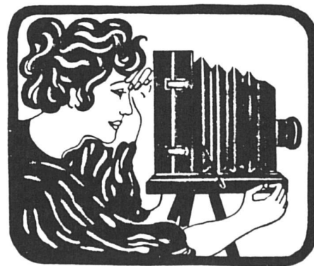
Women's International Bulletin 27.

Aujourd'hui, on est loin du film militant qui embarquait les femmes vers des lendemains meilleurs, comme ce film d'Agnès Varda, « L'une chante, l'autre pas » de 1968, ou ce film bouleversant de Chantal Ackerman sur l'enfermement, la vie d'une femme pendant trois jours dans sa cuisine, « Jeanne Dielman », de 1975. On était alors dans les années de dénonciation, les années de revendication. En 1987, les films de fiction sont concentrés sur des biographies de femmes, des souvenirs d'enfance autobiographiques, des sujets de fiction qui ne mettent pas uniquement des femmes en scène, mais dans lesquels on trouve souvent une revendication politique commune aux deux sexes, une mise en accusation de la société dans son ensemble. Seuls les films qui ont pour sujet les lesbiennes,