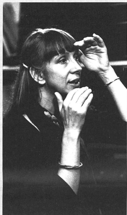
Suzanne Osten, réalisatrice de « Les frères Mozart »

En sortant de la salle de projection, j'ai noté sur mon calepin : Ouf ! Enfin un film plein d'humour !