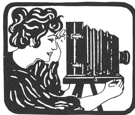
Women's International Bulletin 27.

Aujourd'hui, on est loin du film militant qui embarquait les femmes vers des lendemains meilleurs, comme ce film d'Agnès Varda, « L'une chante, l'autre pas » de 1968, ou ce film bouleversant de Chantal Ackerman sur l'enfermement, la vie d'une femme pendant trois jours dans sa cuisine, « Jeanne Dielman », de 1975. On était alors dans les années de dénonciation, les années de revendication. En 1987, les films de fiction sont concentrés sur des biographies de femmes, des souvenirs d'enfance autobiographiques, des sujets de fiction qui ne mettent pas uniquement des femmes en scène, mais dans lesquels on trouve souvent une revendication politique commune aux deux sexes, une mise en accusation de la société dans son ensemble. Seuls les films qui ont pour sujet les lesbiennes,