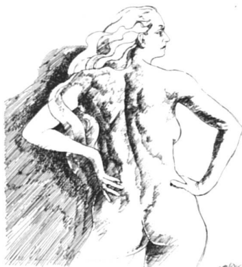
Dessin MS janvier 1981.

« Rosa Canina » continue le travail, mais les sept « licenciées » ont lancé un appel pour recréer une alternative aux accouchements hospitaliers.