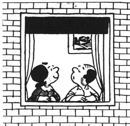
Que dirais-tu, chérie, de résilier le bail ?

La séparation de fait des époux, la suspension de la vie commune par décision du juge ou l'instance en divorce n'enlèvent pas au logement son caractère familial. C'est surtout dans ces situations-là que l'époux non locataire ou non propriétaire du logement familial a besoin d'être protégé.