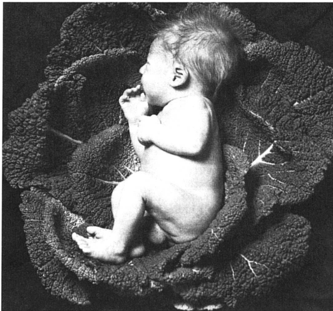
Quand les bébés naissent dans les choux : c'était le bon temps...

A fin juillet 87, on comptait en Suisse 44 bébés nés in vitro et du transfert d'embryons. L'insémination artificielle se pratique depuis une vingtaine d'années; près de 1 % des cas comportent une insémination hétérologue (avec donneur anonyme), mais les techniques de fécondation artificielle ne sont pour le moment soumises qu'aux recommandations de l'Académie suisse des Sciences Médicales et à quelques législations cantonales. L'initiative du Beobachter demandant une législation fédérale a été déposée au printemps; la Suisse sera bientôt saisie d'une recommandation du Conseil de l'Europe, et la commission d'experts nommée par le Conseil fédéral annonce le dépôt de son rapport pour la fin de l'année. Et déjà le Conseil des Etats a accepté à l'unanimité, le 6 octobre, le principe d'une législation fédérale, à la suite d'une initiative cantonale saint-galloise.