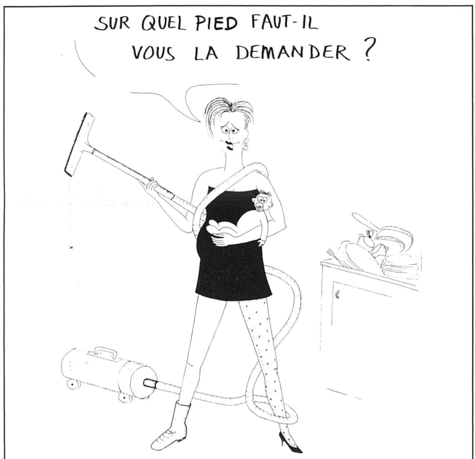
Dessin de Michel Andrey

Les innovations en matière de protection de la maternité sont bien entendu celles qui intéressent le plus les femmes. Elles