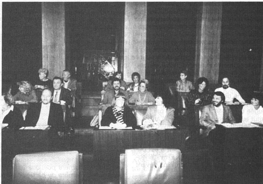
Le groupe des députés socialistes dans la salle du Grand Conseil genevois, en décembre 1986 : 11 femmes et 7 hommes (un homme malade ne figure pas sur la photo). L'exception qui confirme la règle !

Le cas du canton de Vaud, enfin, est exemplaire. Aux élections cantonales de