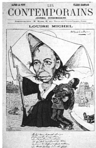
Louise Michel, « la nonne rouge », caricature de 1880.

La Bibliothèque Marguerite Durand, à Paris, édite une série de 7 cartes postales reproduisant des documents anciens appartenant à ses collections. Voilà qui va faire plaisir aux collectionneuses de documents relatifs à l'histoire des femmes. Ces cartes peuvent être commandées à l'Agence culturelle de Paris, 6, rue François-Miron, 75004 Paris. (Prix : FF 2.50 la pièce).