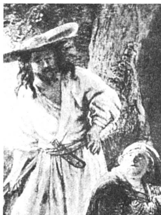
Rembrandt, le Christ avec Marie-Madeleine.

Et s'il y avait eu aussi douze apôtres qui se fussent appelées Marie, mère de Jésus, Marie Magdeleine, Marie et Marthe de Béthanie ?... Les rares pages où ces femmes et leurs amies apparaissent, témoignent qu'elles ont aussi suivi Jésus de Nazareth, elles en ont entendu le message d'amour et de service du prochain, et il les a aimées comme il a aimé ses compagnons. Mais l'Église ne s'est jamais demandé si ces femmes avaient entendu, reçu le message de Jésus d'une manière différente de celle où les apôtres et les évangélistes l'ont transmis.