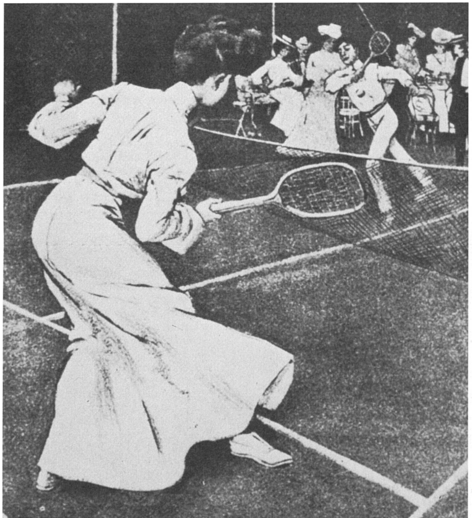
Tennis en 1903. Malgré la robe, gare au smash !

Même si une image plus sportive de la femme s'est répandue ces dernières décen-