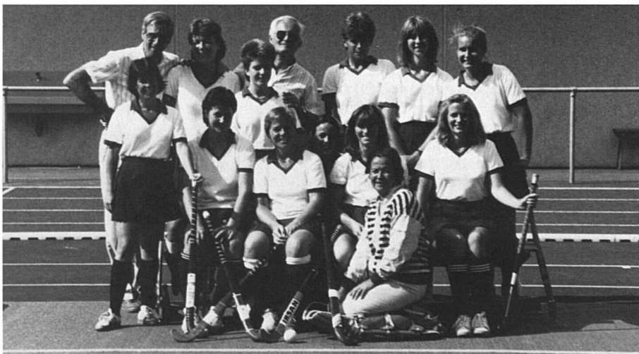
Le sourire des hockeyeuses.

Enquête de la rédaction et des correspondantes cantonales