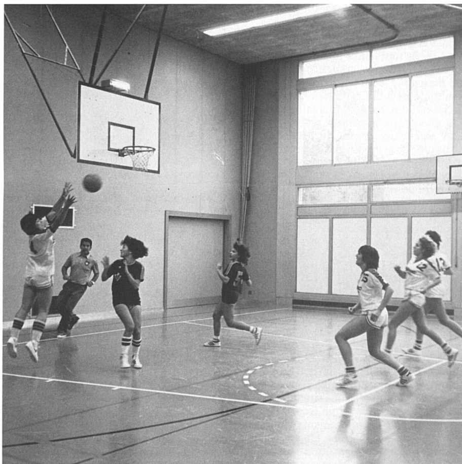
Les sportives nouvelles sont arrivées.

Dans les cas où les associations faîtières ne sont pas mixtes (associations de gymnastiques vaudoise, valaisanne et jurassienne), la situation varie de canton à canton. Dans le canton de Vaud, la dis-