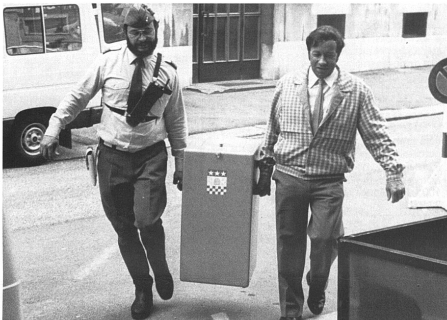
Le poids des urnes: pas très lourd pour les femmes. — (Gerber + L'Impartial)

Faut-il le préciser: sans contestation, c'est un homme qui a été proposé, venant de la filière désormais habituelle, le passage quelques années dans l'antichambre de la chancellerie. Alors, sur ces marches de palais à gravir, on peut songer maintenant à placer une chancellerie. Aux premiers sondages, ces braves messieurs seraient mûrs pour cette solution-là, à moins qu'en coulisses d'autres stratégies soient étudiées. Cherchons la femme pourquoi pas, même si dans quatre ou huit ans elle ne gravit pas plus haut l'échelle du pouvoir. Ce serait un pied dans la maison, et les Neuchâteloises doivent être attentives à occuper le terrain.