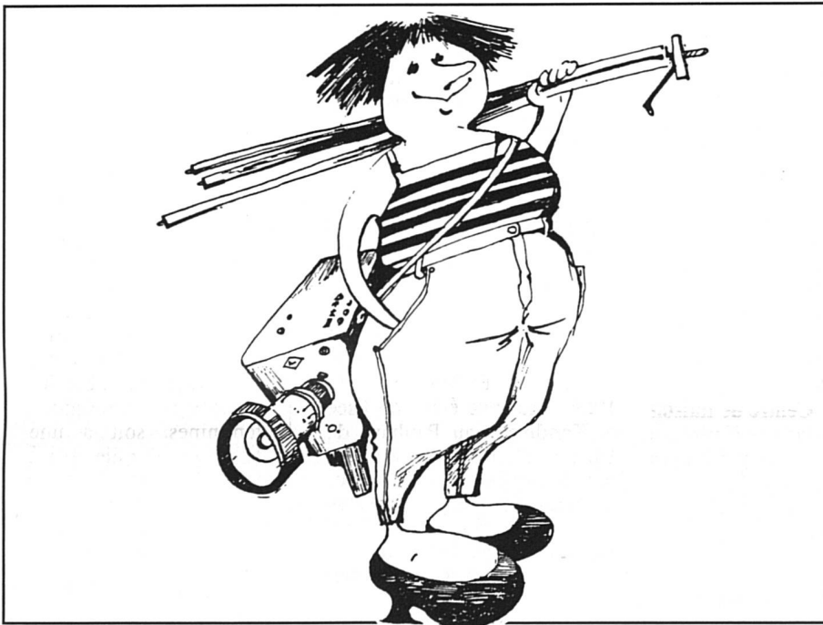
Women's International Bulletin 27.

Le Festival de films de femmes remporte un succès croissant et mérité.