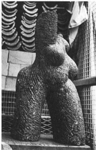
« Ciel », granit vert des glaciers, 1988.