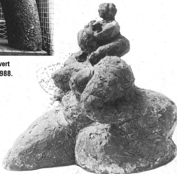
« Maman », ciment, 1984.

1 FS 03882 BIBLIOTHEQUE PUBLIQUE ET UNIVERSITAIRE SERVICE DES PERIODIQUES 1211 GENEVE 4