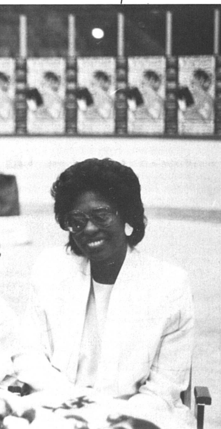
intellectuelles noires, était présente à Montréal.