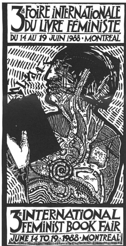
Affiche de la 3 e Foire internationale du livre féministe.

Autre avantage de cette foire, les intéressées n'ont pas besoin de prouver par « a » plus « b » la nécessité d'une écriture féminine, féministe. Elles parlent contenu, qualité, vente... Et devraient même en parler plus, de l'avis de certaines éditrices venues là pour discuter, entre professionnelles, des