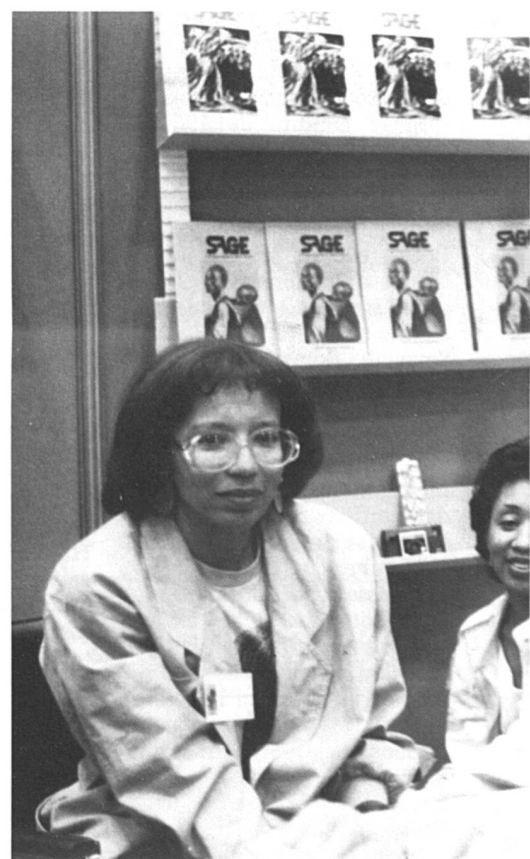
L'équipe de SAGE, publication trimestrielle des

stratégies de vente et de solidarité dans le partage des expériences. Une nécessité si l'on observe le panorama du livre féministe qui, depuis la flambée des maisons d'édition dans les années septante, s'est rétréci comme peau de chagrin. En RFA par exemple, bon nombre d'éditrices ont fermé leurs portes. Les causes sont multiples : la mauvaise gestion, les changements de besoins du marché, l'impossibilité de s'adapter aux normes de rendement et de rapidité exigées en cette fin de siècle trépidante. Autre facteur non négligeable, les