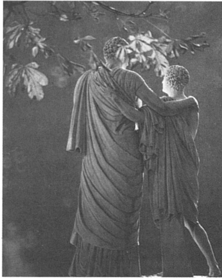
« Le maître et son élève » statue du parc du Château de Versailles. La transmission de la connaissance : une expérience virile ?

Il est vrai que l'Université de Zurich a été la première à abriter une série de conférences « sur les femmes », sous le titre « Frauen, Realität, Utopie », et qu'elle a donc une longueur d'avance sur celle de Lausanne. Il est vrai aussi que plusieurs de ses facultés offrent des cours axés sur des problématiques féministes. C'est le cas d'ailleurs aussi dans d'autres universités suisses, comme par exemple à Bâle, où le séminaire de droit a accueilli début 1988 sept spécialistes de recherche féministe en