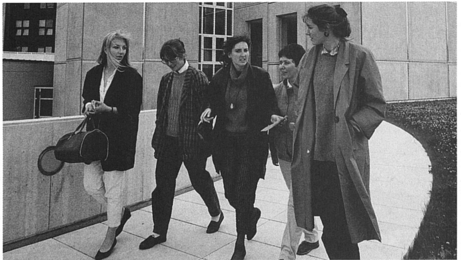
Étudiantes de l'Université de Lausanne : pourquoi ne grimpent-elles pas ?

Afin de compléter ce tableau, quelques chiffres montrant la perte de vitesse des femmes au fur et à mesure de l'ascension dans la hiérarchie académique. En 1986, 44,4 % des élèves à avoir une maturité en poche sont des femmes. Elles sont 40,2 % de celles/ceux qui s'inscrivent à l'université, 35,9 % de celles/ceux qui passent le cap de la première année et 32,4 % de celles/ceux qui vont jusqu'à la licence. Seulement 19,9 % des jeunes qui se lancent dans l'aventure du travail de doctorat sont de sexe féminin.