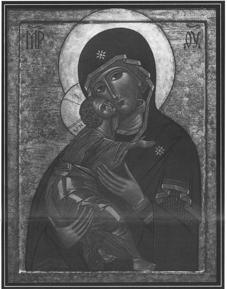
Icone de Notre-Dame de Wladimir, couvent des bénédictines du Mont des Oliviers à Jérusalem : Marie, la maman de Jésus...

* Julienne de Norwich, théologienne anglaise du Moyen Âge, l'une des mères de la théologie féministe.