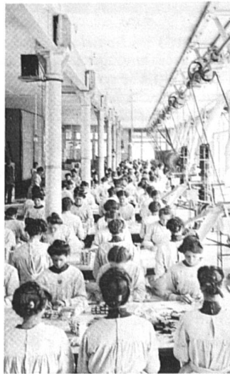
Ouvrières chez Maggi, en 1900.

textile employait avant tout des femmes, alors que (ou parce que) la branche périlait de plus en plus. Ou: les professions exercées uniquement par