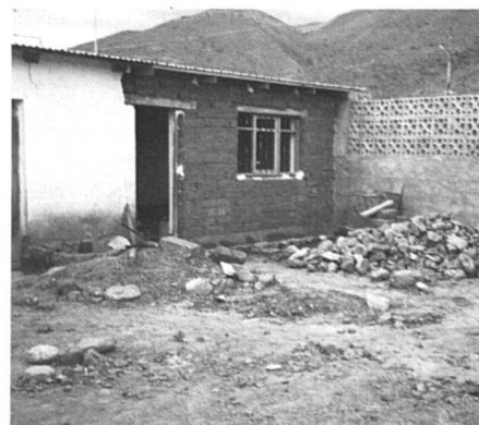
Ici se bâtit la future garderie pour les petits de Villa Pagador. Elle est entièrement construite par des femmes en-dehors de leurs heures de travail.

L'IFFI est une organisation non-gouvernementale, dont le financement est assuré par une organisation faîtière des Eglises protestantes du Canada. Sept femmes, toutes boliviennes et toutes mères de famille y travaillent. Chacune a une responsabilité bien définie, mais toutes les décisions se prennent en équipe. Elles participent également à une coordination du travail éducatif au niveau régional et national. Avec deux autres institutions privées et indépendantes, s'occupant de mineurs et de paysans, elles organisent des rencontres pour une évaluation commune des expériences et du concept méthodologique