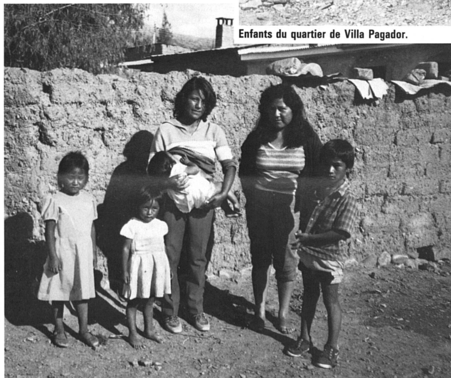
Décidées à lutter pour survivre et assurer l'avenir de leurs enfants.

pas, vivre plus sainement, prendre des responsabilités, assurer l'auto-financement. C'est un lieu de vie et de convivialité.