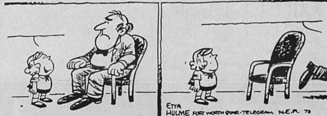
Isis, Women in action, 1987/4.