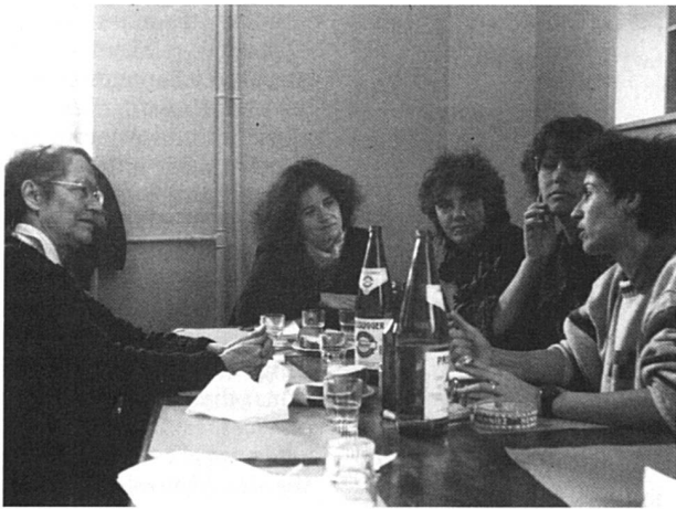
En conversation avec des féministes suisses.

« Si vous êtes féministe, vous êtes forcément antimilitariste. Si vous êtes antimilitariste, vous êtes forcément féministe. » C'est le message qu'a tenté de faire passer Andrée Michel lors de son passage à Bienne, invitée par F-Info à l'occasion de la Journée internationale de la femme.