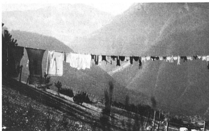
« Résultat d'un travail toujours insuffisamment reconnu ».