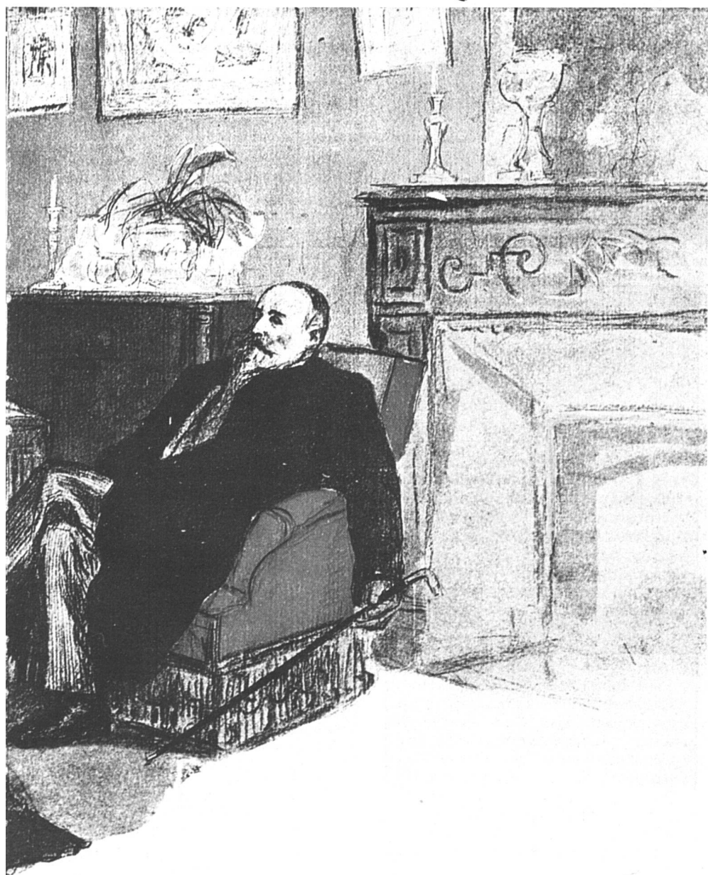
L'entremetteuse, la « fille » et le client dans une caricature de la Belle Époque.

La plupart des prostituées, les quelques clients qui se sont confiés à la télévision ou aux journaux, dénoncent en bloc la frigidité et le manque d'intérêt des épouses, la nécessaire division du travail sexuel : on ne fait pas avec sa légitime ce que l'on fait avec une pute. Pourtant tous et toutes affirment rester dans une sexualité sinon propre en ordre, du moins à la papa. Les hommes iraient chez les prostituées pour pouvoir prendre leur temps contrairement à ce qui se passe chez eux, pour ne pas perdre de temps en préliminaires, ne pas avoir à se soucier de la jouissance de l'autre, faire « ça » avec une vraie spécialiste, oser la fellation et les très populaires caresses à