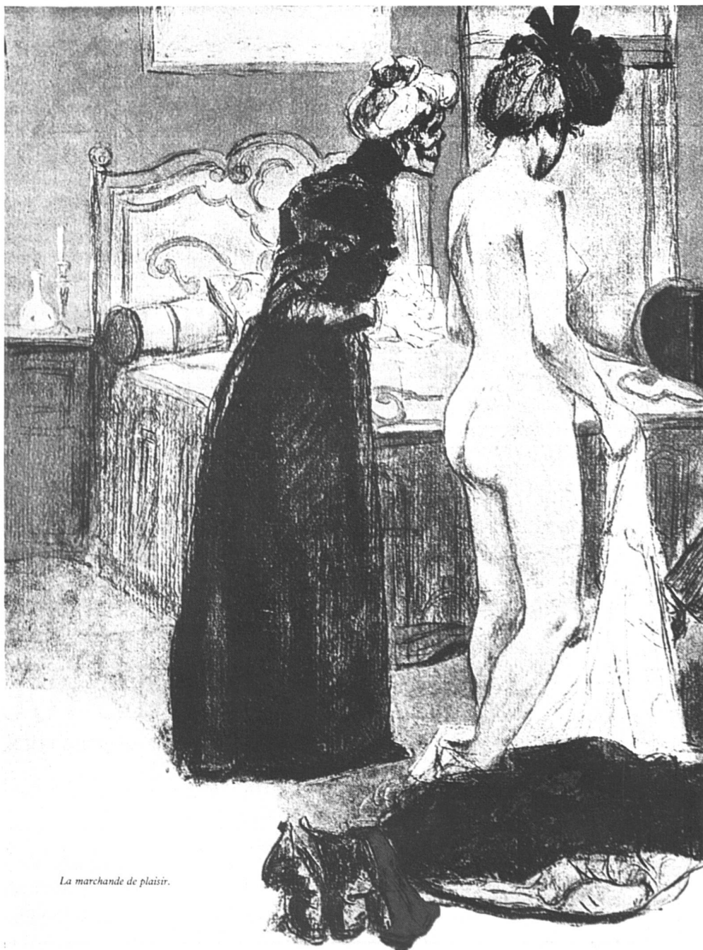
La marchande de plaisir.

Dans la civilisation occidentale, les femmes, historiquement, ont été vendues ou échangées en vue de la procréation et de la reproduction immédiate. Cela a été aggravé par le christianisme qui voulait que la femme soit la servante de l'homme, comme celui-ci était le serviteur d'un Dieu interdisant la « fornication » dans le mariage. Mais les femmes n'étaient pas uniquement reproductrices ; elles étaient le fétiche, elles servaient de passe entre les hommes. Devenues monnaie vivante, elles devaient