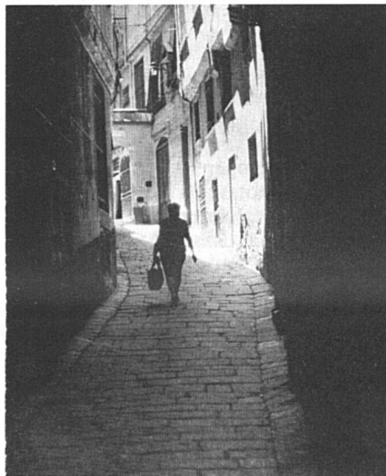
La violence sexuelle, un crime contre la liberté

Un an après son lancement, la « Carta delle donne » avait donné lieu à plus de 2000 rencontres et initiatives. Reste à savoir dans quelle mesure tout ce ferment aura un impact à long terme sur la politique du Parti communiste et sur la vie publique italienne en général.