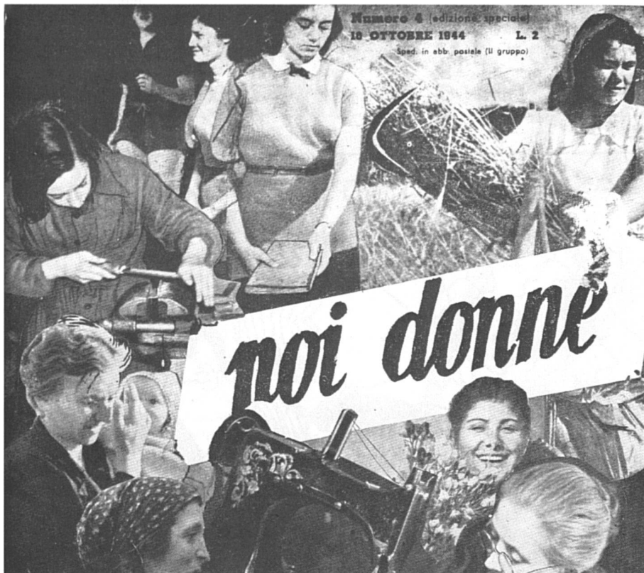
Page de couverture du numéro de « Noi donne » du 10 octobre 1944. La voie de l'émancipation commençait à s'ouvrir.

ques de l'émancipation, qui impliquent la reconnaissance de l'égalité formelle dans tous les domaines, l'abolition des discriminations et de l'oppression, font désormais partie intégrante de l'appareil juridique et de la culture sociale de la péninsule.