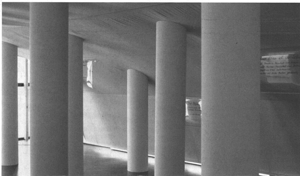
2 e étage.

Quoi ? Une SAFFA 88 ? Les bras m'en tombèrent tellement, quand je reçus la nouvelle, que j'en oubliai que 88 était déjà passé et 1989 bien entamé. La SAFFA... encore un sigle d'initiés-e-s, car il faut avoir étudié soit l'histoire du féminisme soit l'histoire de l'architecture pour savoir qu'il s'agit là des initiales allemandes de l'Exposition nationale suisse du travail féminin.