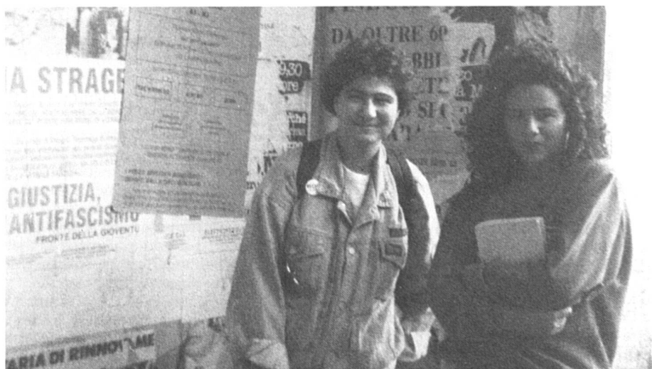
La scolarisation des filles fait des progrès foudroyants.

Les femmes plus âgées, nées trop tôt pour pouvoir profiter de cette évolution, ont néanmoins pu bénéficier d'un accroissement spectaculaire de l'offre en matière de formation continue. Par exemple les