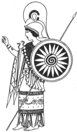
Athéna ou Minerve, déesse de la sagesse, des arts domestiques et de l'artisanat.

Ces ouvrages peuvent être obtenus à F-Information, case postale 757, 1211 Genève 3, tél. (022) 21 28 28.