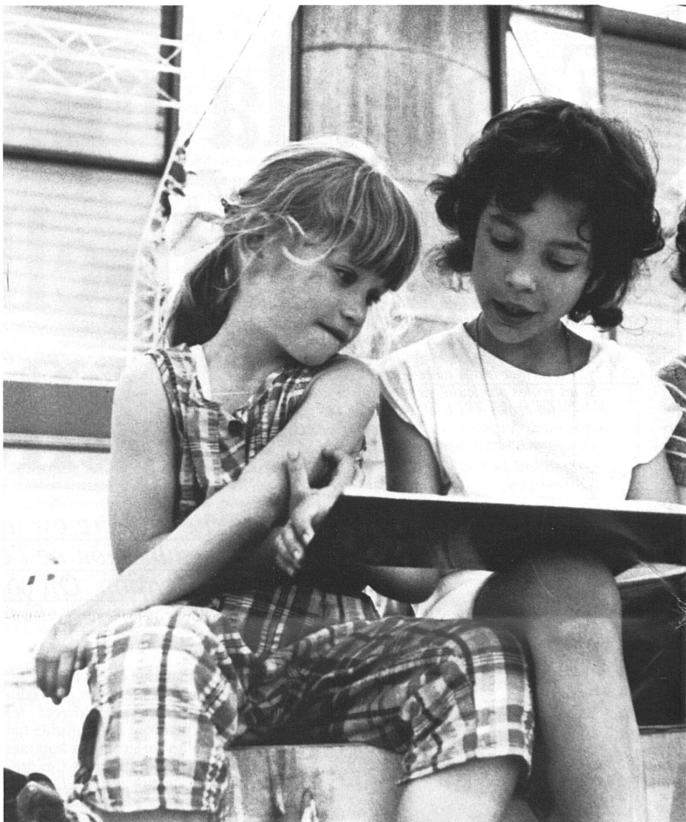
Les filles sont plus vites mûres dans le domaine intellectuel.

Un enseignant d'un collège de jésuites, privé et cher, a découvert voilà trois ans la mixité : « C'est formidable ! Tout d'abord parce que les filles sont plus scolaires et travailleuses. Elles réussissent en général mieux dans toutes les matières et entraînent les garçons. Ensuite, eh bien, les garçons découvrent d'autres attitudes que la brutalité ou la force dite virile, d'autres sports que le rugby et le football. »