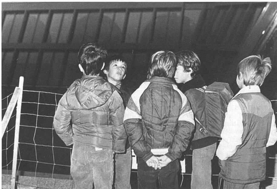
Insécurisés dans leur virilité ?