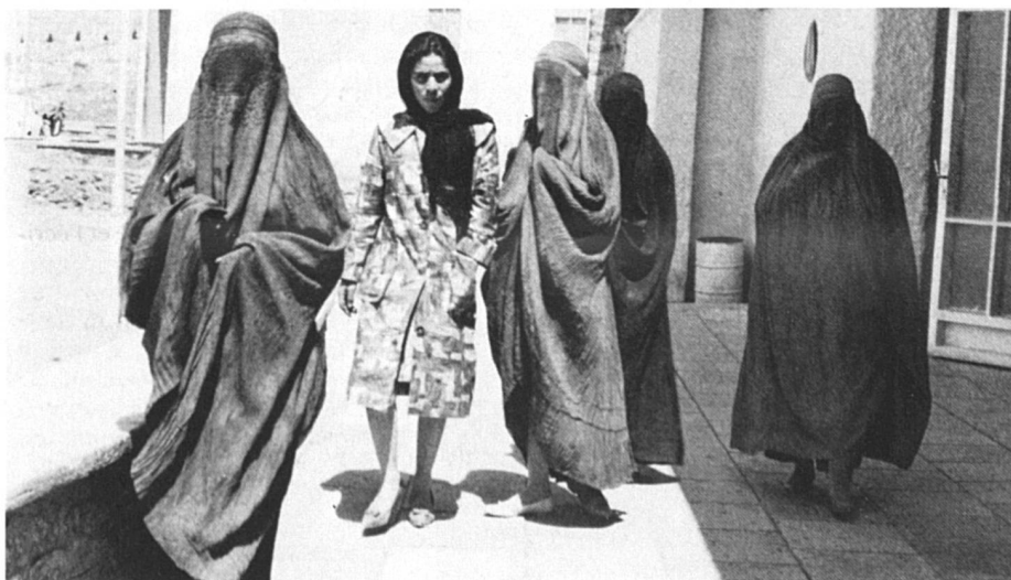
Dans une rue du Caire.

Première Algérienne à être admise à normale supérieure en 1955, son premier roman est publié par Julliard en 56. Six autres suivront. Le premier de ses films, La Nouba des Femmes du Mont Chenoua a reçu le Prix de la critique internationale à Venise en 1979. Lors de sa sortie à la Cinémathèque d'Alger, les femmes étaient quasiment absentes de la salle : « Les femmes ne voient les films qu'à la télévision, puisqu'elles ne sortent pas... »