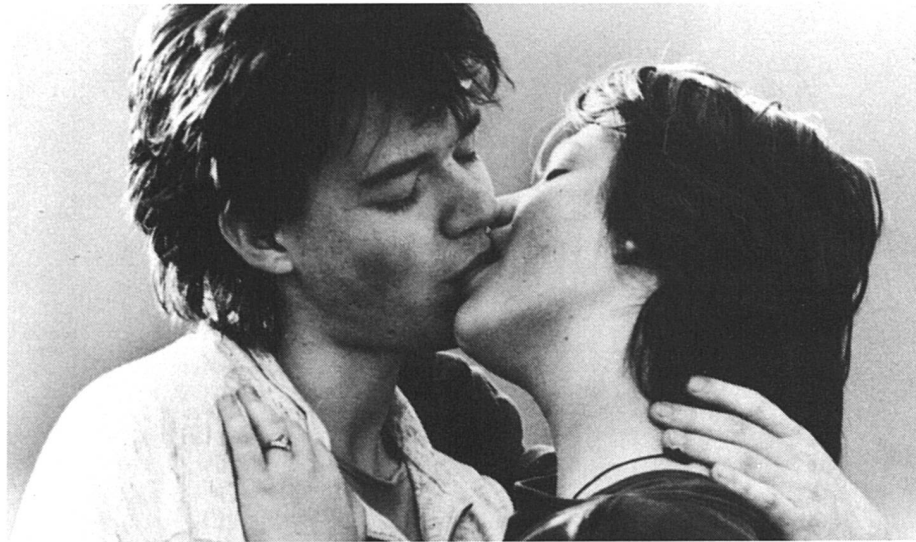
Le sida a-t-il tué l'amour?