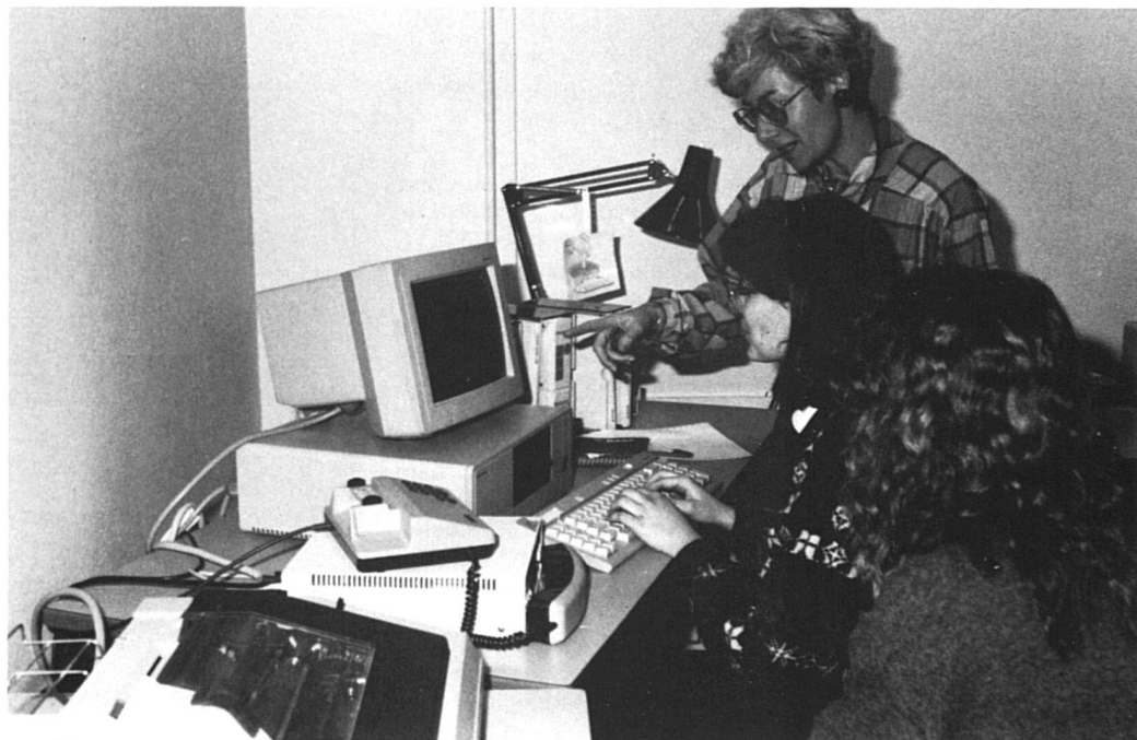
Maîtriser les nouvelles technologies.

La fonction première des bibliothécaires devient ainsi celle de médiateur entre les documents et les besoins des usagers. Dans le nouveau plan d'études, des cours de commu-