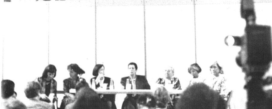
Le galion inaugural.

En face d'un gigantesque galion de l'époque de la « conquista » se pressent des centaines de femmes pour l'inauguration du quatrième rendez-vous des livres au féminin pluriel. Une rencontre au sommet de l'écriture qui s'est tenue du 19 au 23 juin dernier dans l'enceinte de Las Drassanes, un bâtiment gothique situé juste en face du port de Barcelone. Entre ses épais murs de pierre, les organisatrices ont installé une multitude de stands blancs vite décorés de posters colorés, de photos, de revues, de prospectus et bien évidemment de livres. Une foire qui n'est pas passée inaperçue dans la presse espagnole, puisqu'elle a occupé une pleine