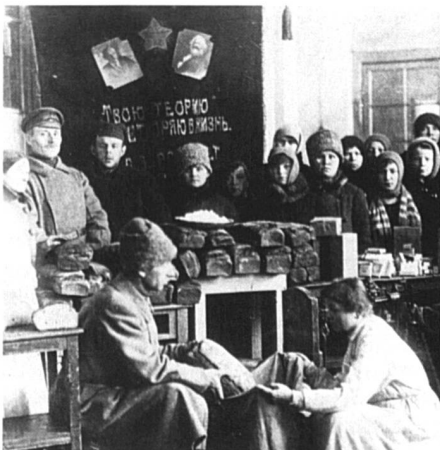
Révolution russe et guerre civile. Distribution de pain. Russie, 1917.

Les dispositions pour la protection et l'assistance aux enfants tendent en priorité à maintenir ou reconstituer les liens des familles dispersées par la guerre ou l'exode.