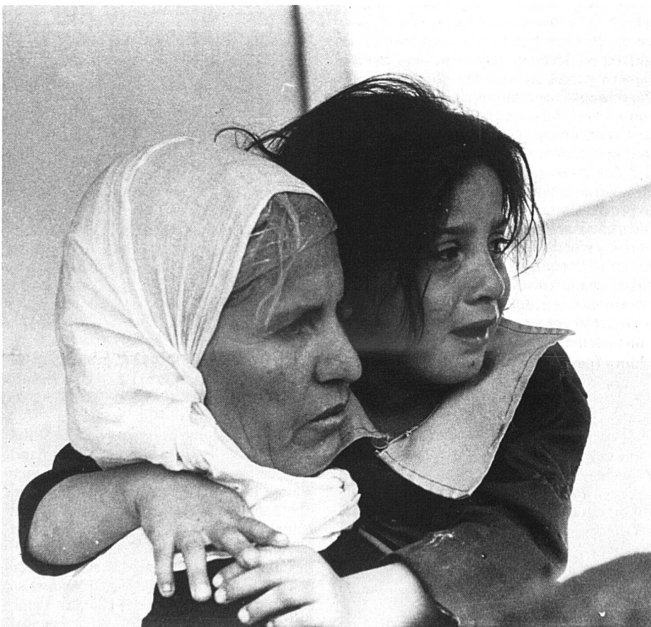
Guerre civile au Liban. Réfugiés palestiniens de camp de Saint-Simon. Beyrouth, Liban, 1976. Document CICR/DICA, Genève. (Photo Jean-Jacques Kunz)

En principe, donc, l'enfant est doublement protégé: en tant que personne ne participant pas, sauf exception, aux hostilités, et en tant qu'être «particulièrement vulné-