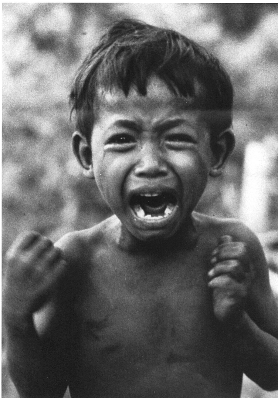
Guerre civile au Kampuchéa. Orphelin. Battambang, Kampuchéa, 1980. Document CICR/DICA, Genève. (Photo G. Leblanc)

Le droit international humanitaire en faveur des enfants se développe, mais reste un instrument insuffisant.