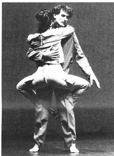
Recoudre les blessures de la guerre des sexes.

La salle est immense, ou plutôt paraît immense à cause des miroirs qui recouvrent complètement deux des parois en vis-