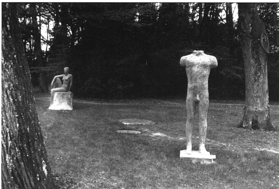
Défaire l'association homme = mental.

Même remarque à propos d'une autre des activités de l'eutoniste, qui anime, en tandem avec une femme médecin, et sous la supervision d'une femme psychiatre, un groupe de thérapie mixte pour des femmes entre 45 et 60 ans qui doivent affronter les deuils caractéristiques de cette tranche d'âge au féminin: émancipation des enfants, vieillissement physique, désillusion quant à la réalité de l'amour romantique, solitude à la suite d'un divorce ou d'un veuvage, ou consolidation, pour les célibataires, d'une solitude qu'on avait espéré provisoire, renoncement définitif à une activité professionnelle ou difficultés liées au