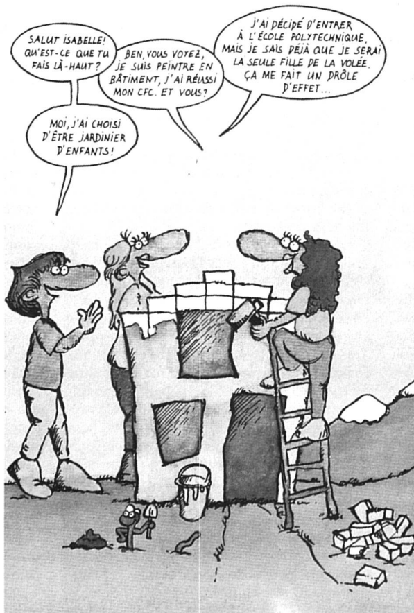
Extrait du dépliant de l'ARCOSP «Pour un avenir différent».

La nouvelle rédaction a déjà eu quelques effets: «Quand on diffuse des dossiers de prêt aux jeunes filles,