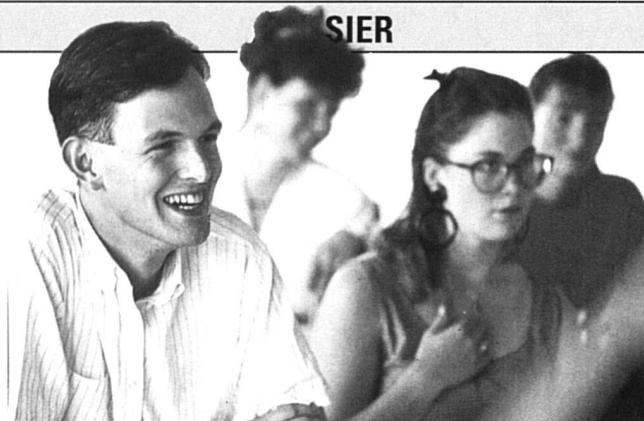
Dépliant de l'École d'infirmières de La Source. Volée 1990-93: 29 femmes et 5 hommes.

Une récente enquête énumérait les dix apprentissages les plus recherchés par les entreprises. Point n'est besoin d'aller longuement fouiller les statistiques pour savoir qu'à une seule exception près (devinette), il n'y a pratiquement aucune jeune fille parmi les apprentis de ces métiers. (On me pardonnera donc le libellé masculin...). Voyez plutôt: maçon; mécanicien; serru-