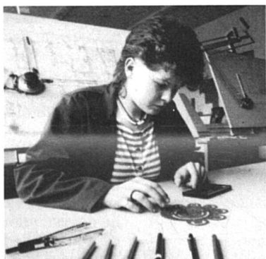
La brochure «Je me prépare à choisir par des stages d'information» du Groupement interprofessionnel (GIP) du canton du Jura et du Jura bernois précise que tous les stages sont ouverts aux filles et aux garçons, et montre l'exemple par la photo.

Une enquête menée sur le tas auprès de 80 jeunes gens et jeunes filles en fin de scolarité par le Groupement interprofessionnel du canton du Jura et Jura bernois (GIP) apporte quelques précisions. A la question: «A ton avis, y a-t-il dans cette liste (environ 200 métiers) des professions que les filles ne peuvent pas apprendre ni exercer?», la moitié (indifféremment garçons et filles) ont répondu oui ! Les professions contestées: forestier bûcheron, agriculteur, les métiers du bâtiment et du génie civil, les métiers de la métallurgie et des