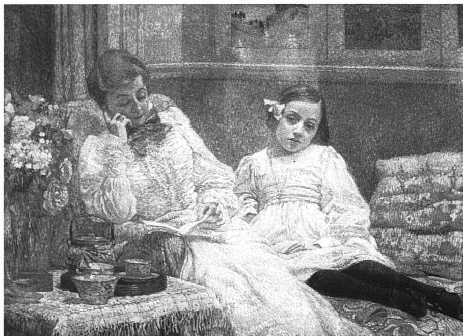
Portraits de la femme et de la fille du peintre Theo van Rysselberghe (1862-1926).

Nous nous sommes également intéressés aux genres littéraires favorisés. Nous en proposons une douzaine, avec la possibilité d'ajouter toutes les «spécialités» de prédilection. La question requérait d'en choisir 3, en les classant par ordre de préférence. Lecteurs et lectrices confondus, ce sont les romans qui viennent très nettement en tête, figurant en première place chez 36% des personnes interrogées, et en première, deuxième ou troisième place dans 65% des choix. Les biographies ou autobiographies ont également leur petit succès: plus rarement citées en premier (18% des réponses), elles apparaissent dans plus d'un tiers des réponses globales. Les ouvrages historiques intéressent un quart des gens et les essais un cinquième. Si l'on décortique les réponses selon les sexes, on retrouve les mêmes tendances qu'aux réponses précédentes. Les femmes sont plus nombreuses à aimer les romans (deux tiers), même si la moitié des hommes sélectionnent également le genre parmi leur trio favori. Les biographies ont la faveur du double de femmes que d'hommes (42% et 20%), proportion exactement inverse pour les ouvrages historiques (21% des femmes, 41% des