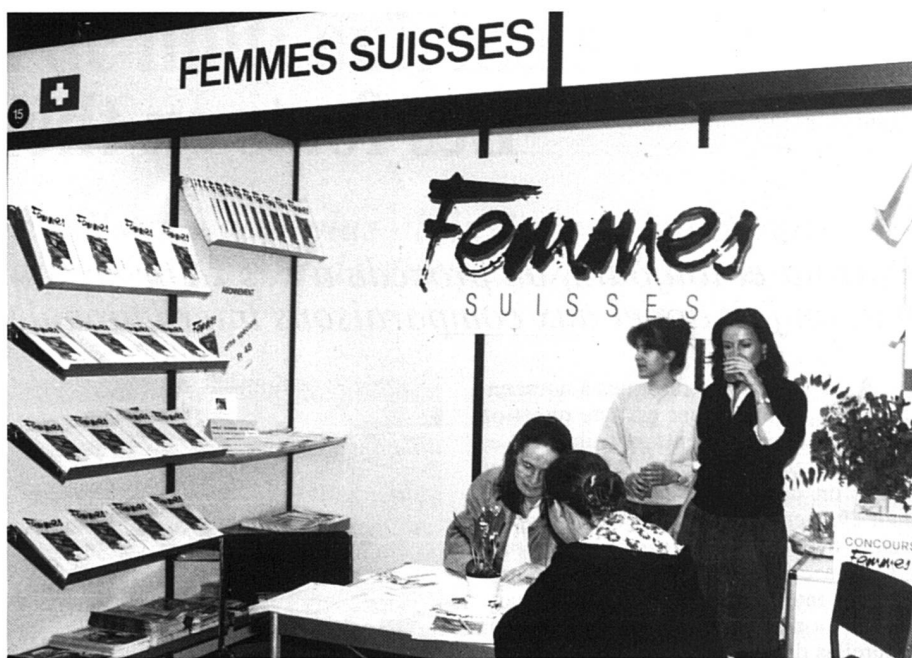
Salon du livre 1991. (photo Mariavicenta Verdaguer).

la dent. Car vous oubliez la presse, grande consommatrice, elle aussi, du temps et de l'argent de lecture.